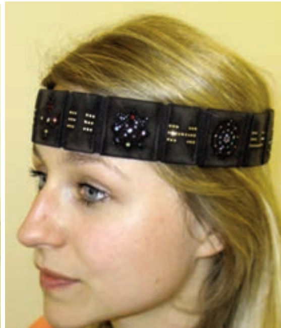
Kristallen Meditatieband © by Peter Mandel